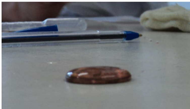
Figura 2: Moeda de 5 centavos com solução aquosa de sal de cozinha

A seguir, foram dispostas duas soluções aquosas: uma contendo sal de cozinha e outra contendo detergente, para que, com o auxílio de outras pipetas e outras moedas, de forma a evitar a contaminação das soluções e alteração do número de gotas, os estudantes pudessem repetir e comparar os resultados com os obtidos somente com a água destilada (Figura 2). Os resultados estão expressos no Quadro 2